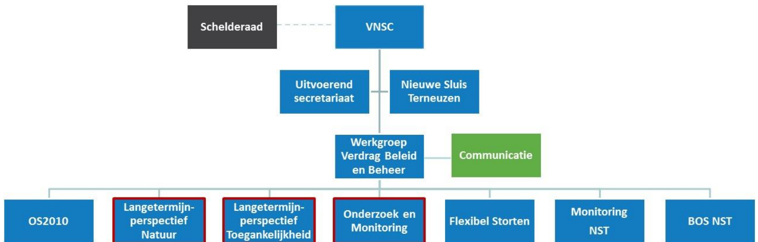
Figuur 2: Inhoud roadmap

De rood omlinjende blokken zijn de inhoudelijke onderdelen van de roadmap.